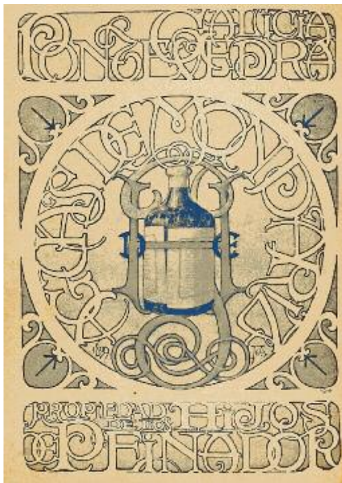
Motivos publicitarios de Aguas de Mondariz, José Arijá, ano 1899

británicos, grazas a que, desde 1908, a Royal Mail Steam Packets e a Booth Line de Liverpool deixaban centos de pasaxeiros no Porto de Vigo con destino, entre outros lugares, ao balneario de Mondariz; en todo caso, entre 1877 e 1931, o 91% dos acuístas pertencían ás clases acomodadas, categoría que coa clase de tropa e a de pobres de solemnidade formaban as estatísticas oficiais, unha categoría, a de clases acomodadas, na que se incluían desde aristócratas e grandes financeiros ata pequenos burgueses; non obstante, a porcentaxe é superior á media española.